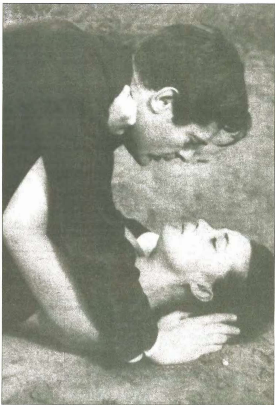
Kadrs no filmas Nakts .

Romas universitātē, kur studēju arhitektūru, biju studentu grupā, kas interesējās par teātri. Tieši tur mani ievēroja, un es nokļuvu