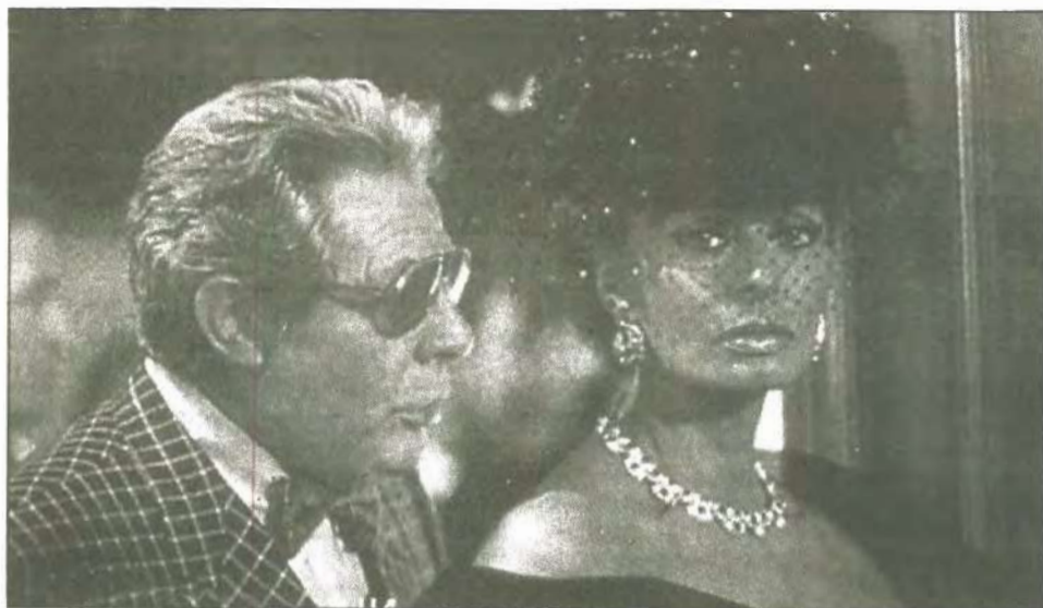
Marcelllo Mastrojāni un Sofija Lorēna.