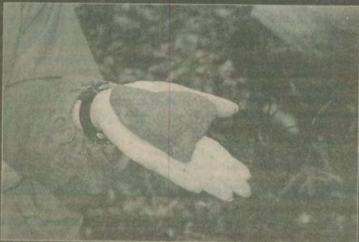
Lasiet 8. un 9. lpp.

Prihvatizācijas otrais posms. Kaislības ap Zinību biedrības namu.