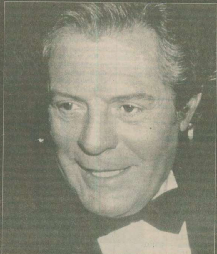
Lasiet 16. lpp.